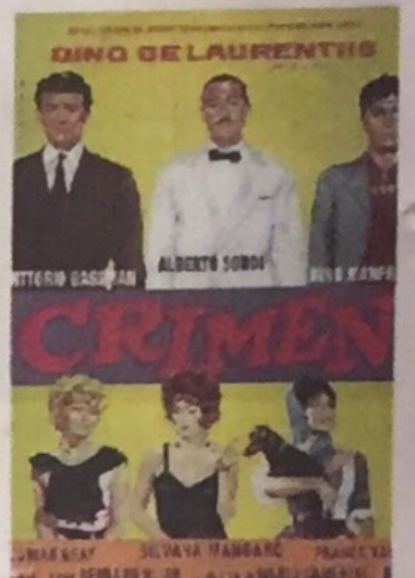
LOCANDINA "Crimen" al Corso